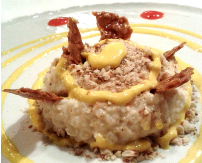
Gocce umide e preziose dell'universo

RISO: alimento universale dell'umanità, sai che è il cereale più mangiato al mondo.