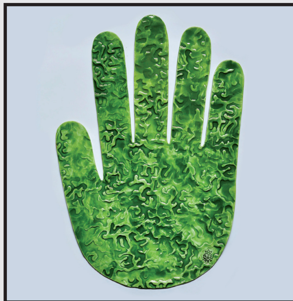
Mano arborea - porcellana maiolicata su piastra di plexiglass cm 47x47

Vive e lavora a Milano, dove si è formata all'Accademia di Brera e attraverso delle collaborazioni con suo padre artista prima e con alcuni maestri dell'arte ceramica di Faenza poi, da lei chiamati a svolgere dei workshop di formazione nel suo laboratorio. L'ispirazione del suo lavoro ha le radici nei percorsi esistenziali legati ai viaggi in India, che le hanno consentito una visione d'indagine interiore più contemporanea. In questo senso è da intendere la sua pratica ceramica, nutrita di riflessioni naturalistiche spesso evocative della relazione dell'essere umano col mondo, come nei labirinti arborei e nell'albero della vita.